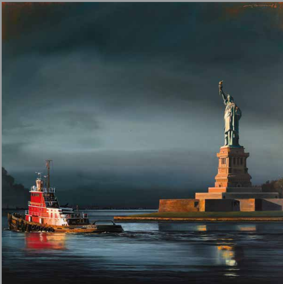
Port de New York - 120 x 120 cm