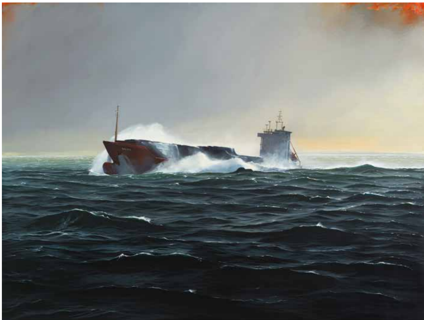
Sun Vitae, contre jour - 130 x 96 cm

Ou encore cet hommage à l'explorateur Ernest Shackleton, sous la forme d'une toile représentant deux majestueux voiliers longeant la banquise, témoignage du respect du peintre à l'égard des aventuriers humanistes.