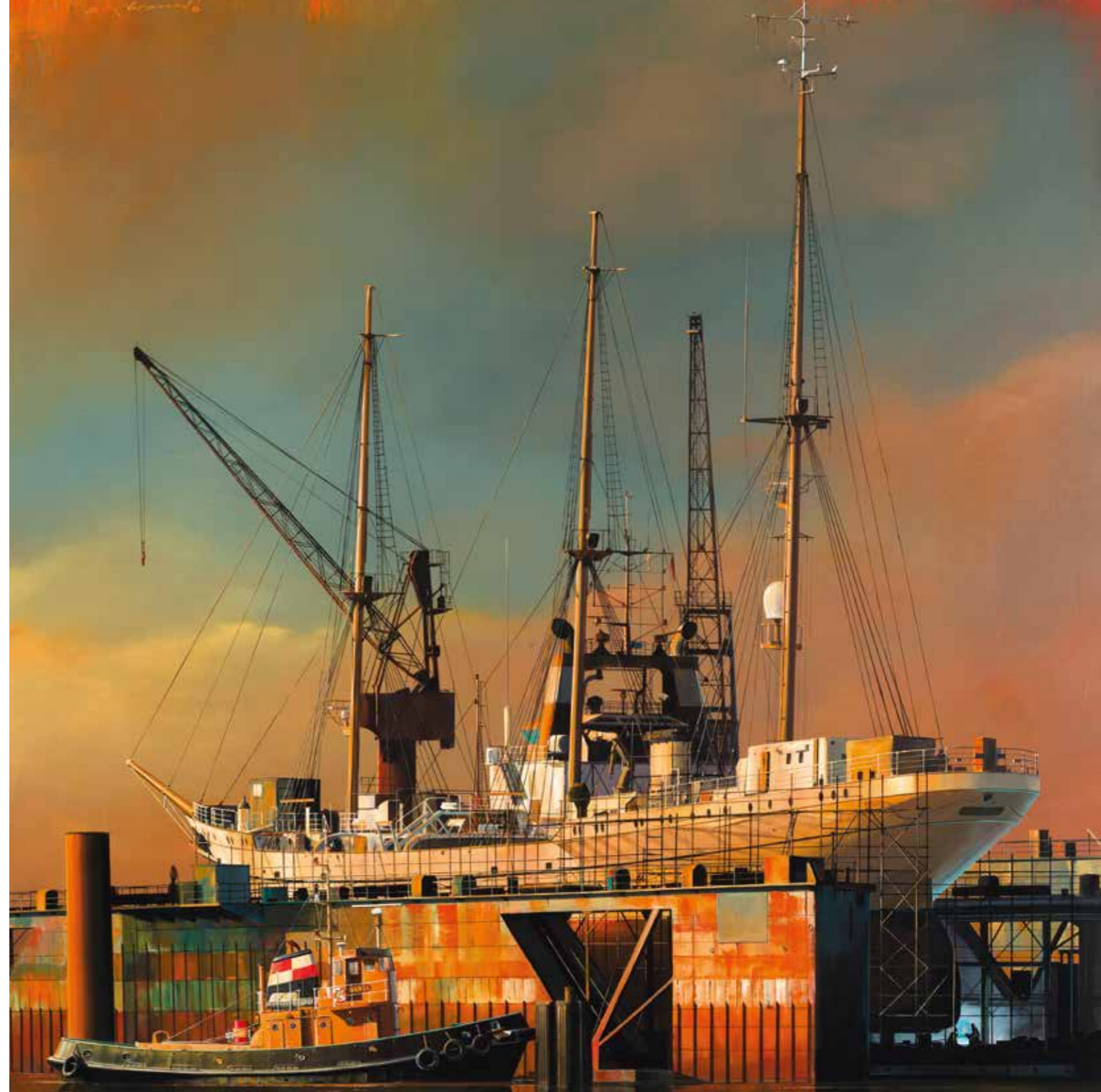
Acier flottant - 120 x 120 cm