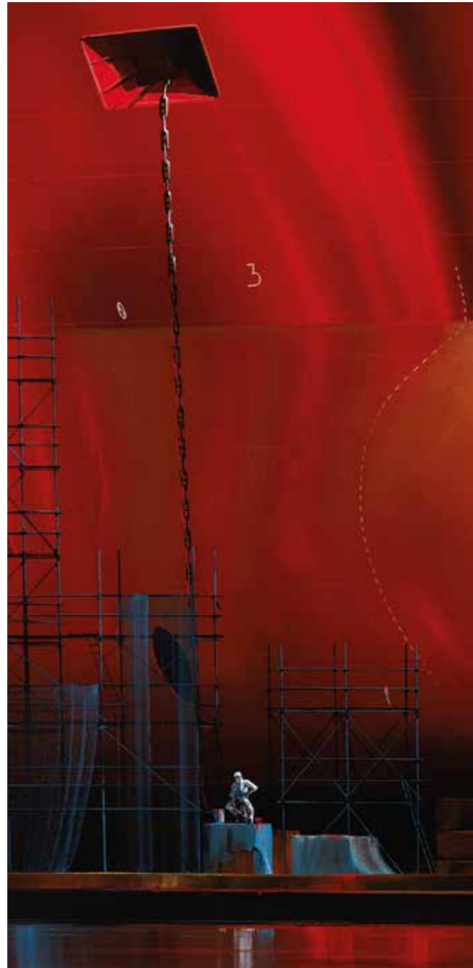
Autoportrait: fin de chantier - 100 x 100 cm (detail)

Il y a enfin le choix de ces scènes dramatiques ou héroïques, comme Sun Vita et Mystery Ship , fiers cargos qui affrontent la houle dans une lumière rasant, symbolisant tout à la fois le devoir à accomplir malgré l'adversité et l'obstination du marin à vaincre les éléments.