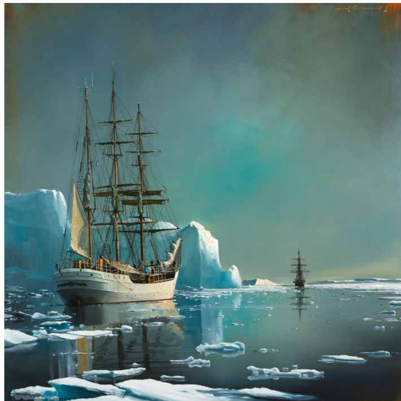
Sur les traces de Shackleton - 120 x 120 cm

La virtuosité de Dirk Verdoorn, sa fantaisie, son savoureux choix de couleurs, sa connaissance des océans et son pinceau hyperréaliste qui ne néglige aucun détail ouvrent ainsi les portes de notre imaginaire naval;