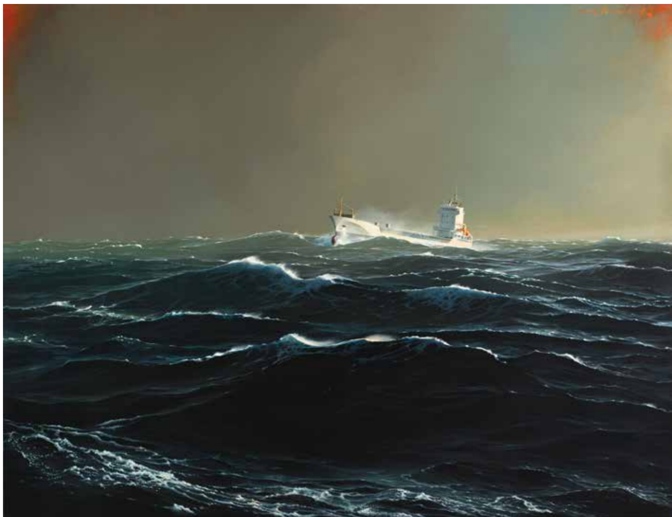
Mystery ship - 130 x 96 cm

par son réalisme, son œuvre donne aux terriens les souvenirs des navigations qu'ils n'ont pas personnellement vécues et apaise les marins revenus à terre de leur impatience d'un nouveau départ. Alors, tous les deux ans, en visitant la Galerie de l'Estuaire, on pense à ce vers de Victor Hugo: La vaste mer me parle et je me sens sacré.