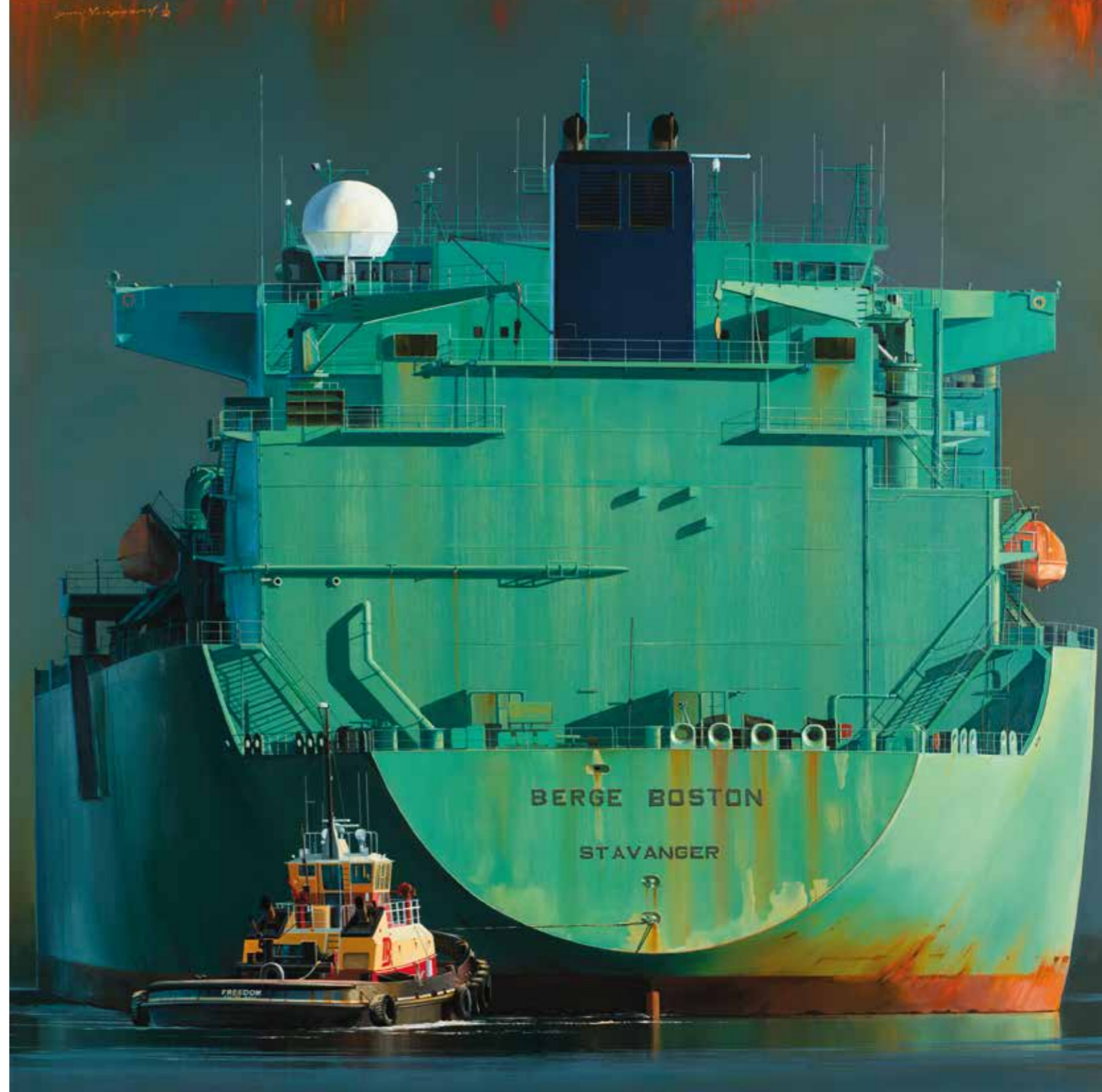
Port de Boston - 120 x 120 cm