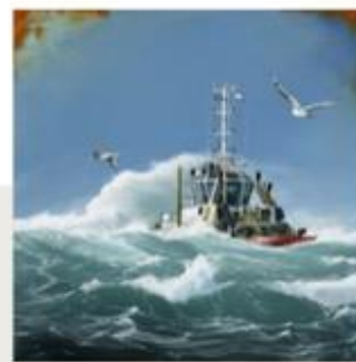
« Cache-Cache - Acrylique sur toile - 60x60 cm »