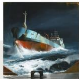
« Rocky Tow - Acrylique sur toile - 60x60 cm »