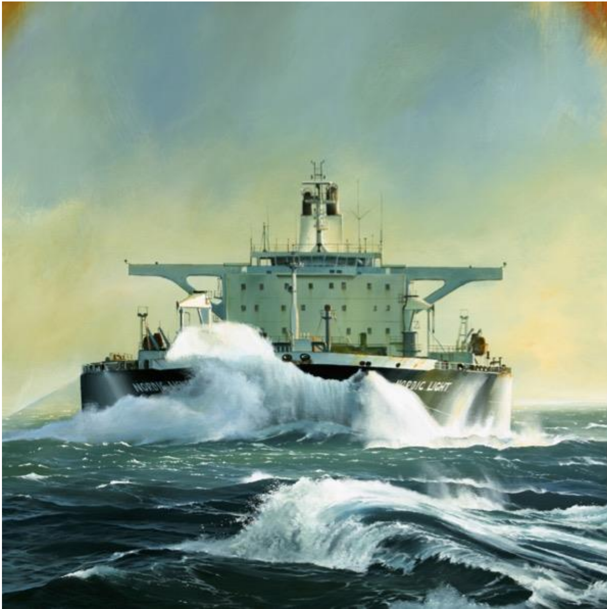
Nordic Light - Acrylique sur toile - 80x80 cm