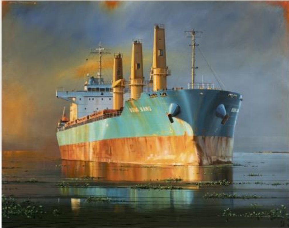
Delta (Mekong) - Acrylique sur toile - BOF

Rose des vents - Acrylique sur toile - BOF/BOF.com