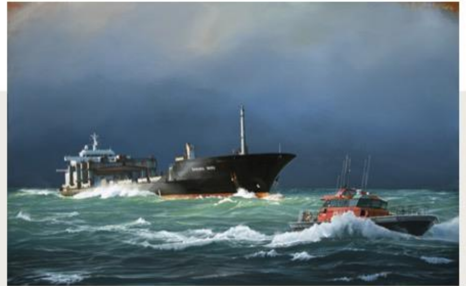
Rokuro Maru - Acrylique sur toile - 50x50