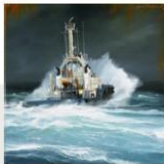
« L'Hollanda - Acrylique sur toile - 60x60 cm »